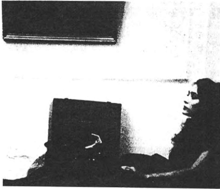
En la anticipación. Werner Schroeter, Willow Springs , 1972.

rían tan atractivas si no siguieran ofreciendo aún proyecciones conmovedoras de antiguos poderes que provocan las formaciones del yo a través del oído. Seducen a sus oyentes en la medida en que prometen convincentemente la entrada en escena decisiva del sujeto en el núcleo-canción. Psicológicamente, hay métodos para llegar al frenesí músico-primitivo. La espera, dispuesta a dar brincos, de los oyentes a la efervescencia en sus gestos tonales más propios confirma la realidad de un arcaico estadio-sirenas conformador del yo, en el que el sujeto se engancha a una modalidad sonora, a un tono de voz, a una fantasía tonal, para esperar así el retorno de su instante musical. Los momentos de verdad que Lacan asignó a su quimérico teorema del estadio-espejo no se pueden aplicar objetivamente a la