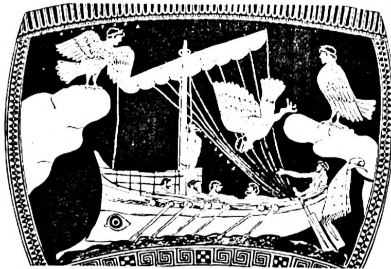
Vaso con figuras rojas, Volci, siglo V a. C. Las sirenas vuelan alrededor de Uliyes como mujeres pájaro.

los agrados: en ello se muestra la tensión que las grandes culturas han de mantener en quienes las sostienen para combinar una elevada apertura mundana con una no-seducibilidad acrecentada. La subjetivación crítica se basa en la des-fascinación en tanto contención en conmoverse. Desde que la cultura de la escritura hizo valer su ley, ser sujeto significa ante todo: poder resistirse en principio y la mayoría de las veces a las imágenes, textos, discursos y músicas con que uno se encuentra, exceptuando aquellos cuyo derecho a forzar mi adhesión y conformidad lo tienen concedido de antemano por algún motivo: los llamamos iconos, libros sagrados, escritos de los Padres, himnos y clásicos. En éstos reconocemos los potenciales de convicción, sostenedores de cultura, que han superado suficientes veces el examen de la crítica como para poder desarmarnos en cierta medida también a nosotros, los sujetos actuales de la negativa. Convicción es sólo un nombre para conmoción poscrítica: significa la vuelta del juicio favorable a las alturas del conocimiento