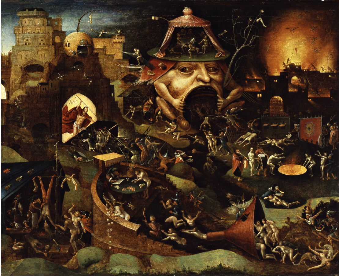
Jheronimus Bosch. Descenso de Cristo a los infiernos . Hacia 1575.

psicoanálisis hay una analogía entre las obras de arte y el sueño. Pero, como veremos, esta analogía va más allá de la afirmación borgiana sobre la estética y apunta, incluso, a sus mecanismos de producción.