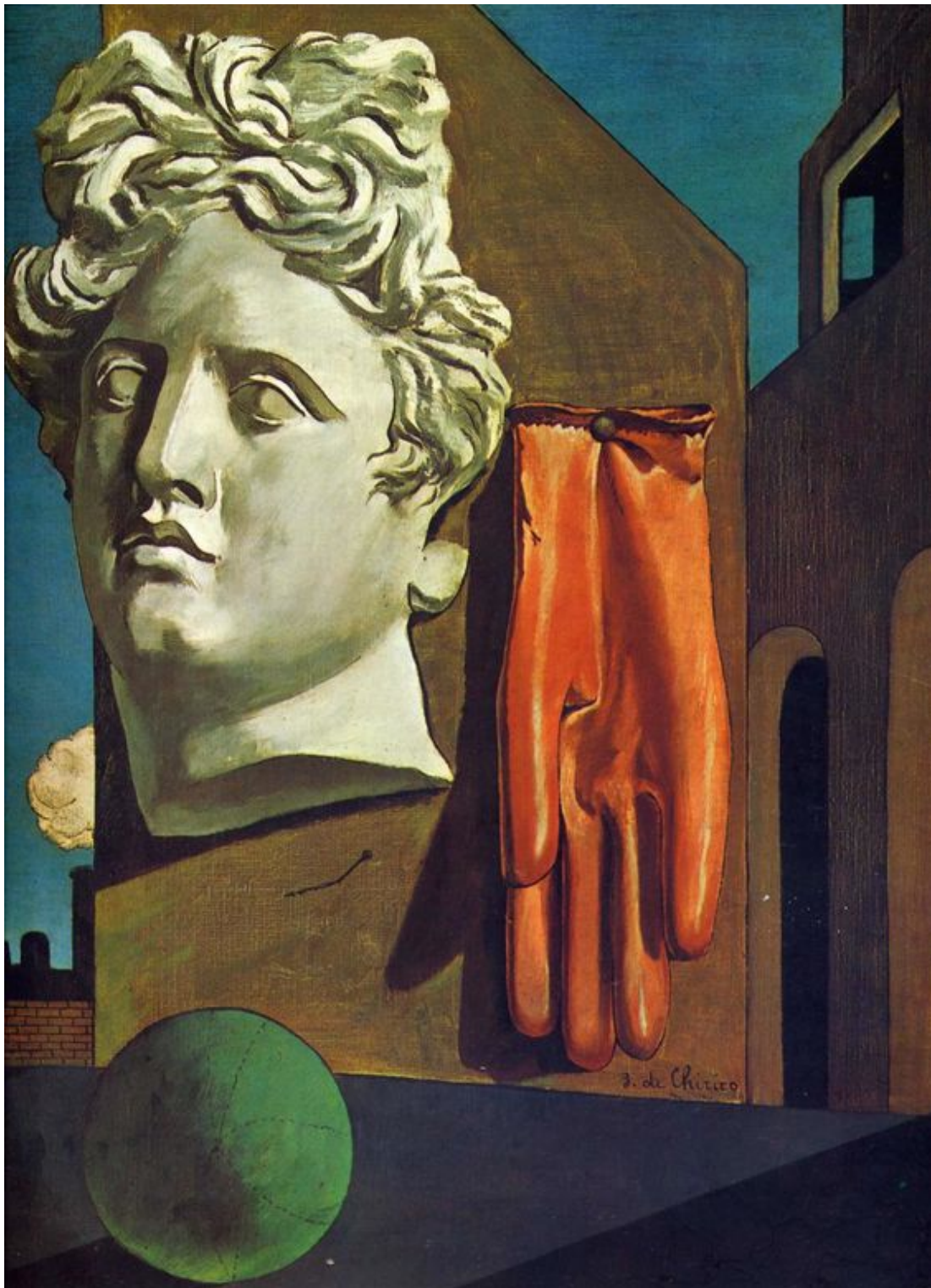
Giorgio de Chirico, Canción de amor ; 1914.

representación, juntó en un mismo lienzo una monumental cabeza clásica y un enorme guante de goma en una ciudad desierta, titulándolo Canción de amor 4 .”