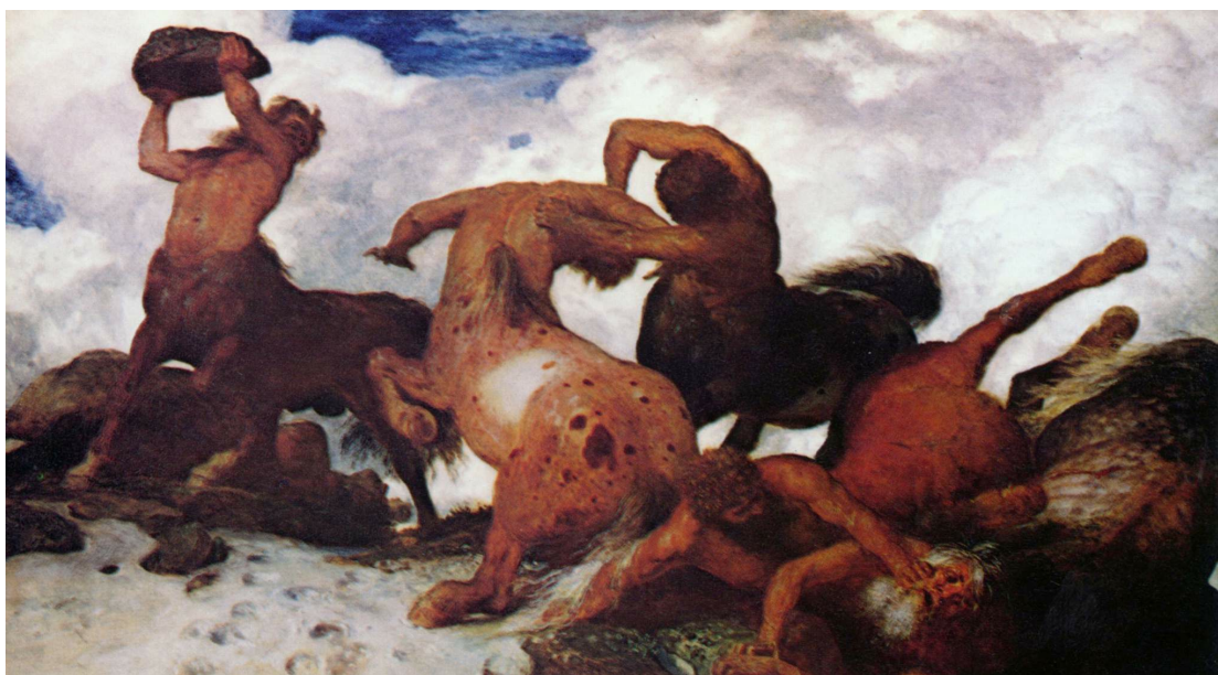
Arnold Bröcklin Lucha de centauros

“La formación de las personas mixtas del sueño halla sin duda homólogos en muchas creaciones de nuestra fantasía, que compone fácilmente en una unidad ingredientes que en la experiencia no se copertenecen, como, por ejemplo, en los centauros y animales fabulosos de la mitología antigua o en los cuadros de Bröcklin. En verdad, la fantasía «creadora» no puede inventar cosa alguna, sino sólo componer partes ajenas entre sí. 7 ”