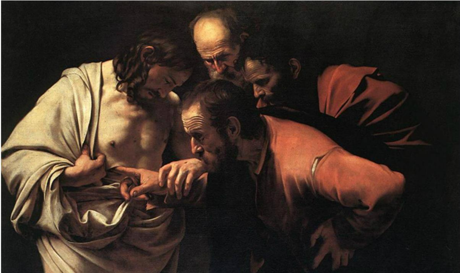
La incredulidad de Santo Tomás (Incredulità di San Tommaso) Caravaggio, 1602