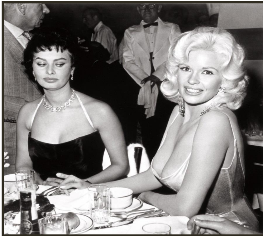
Sofía Loren - Jayne Mansfield 1957