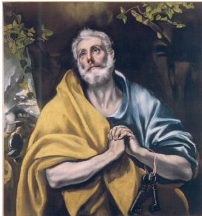
Las lágrimas de San Pedro , (1613) Doménikos Theotokópoulos «El Greco»