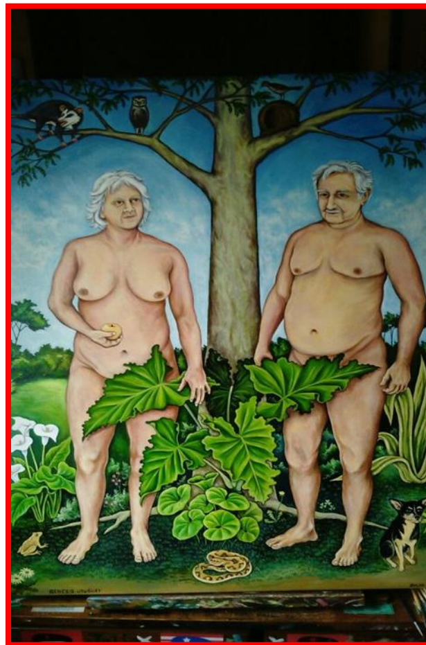
Génesis Uruguay , de Julio de Sosa (2016)