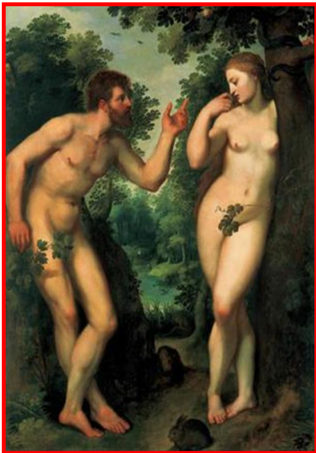
Adán y Eva , de Pedro Pablo Rubens (1629)