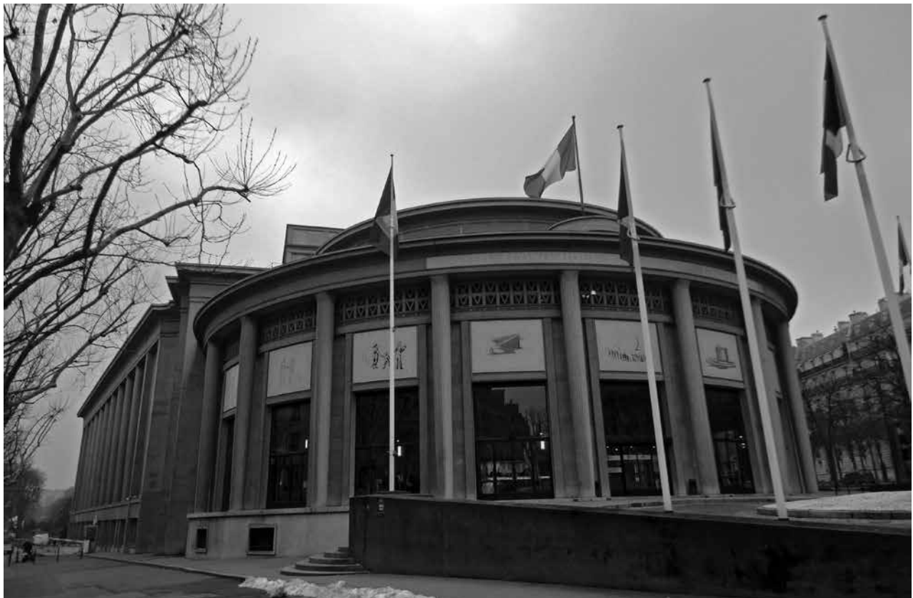
Figura 2: Palais d’Iéna Vista del Palais d’Iéna, sede del Conseil économique, social et environnemental (anteriormente: Musée national des Travaux publics).

ubiertas en el Renacimiento, se pasó a aquellas de la Edad Media rehabilitadas en el siglo XIX bajo el impulso de Viollet-le-Duc, y más tarde a las producciones del periodo moderno y del contemporáneo (la Ley de 1913 contaba apenas con una decena de monumentos del siglo XIX, y la Ópera Garnier fue clasificada en su totalidad apenas en 1923). Sin embargo, estas últimas producciones fueron tenidas en cuenta por la última generación, que aún dudaba en hacerlo, en medio de resistencias más o menos violentas: numerosas obras de los siglos XIX y XX fueron destruidas, o bien a nombre de un imperativo de modernización, o bien a nombre de exigencias dadas por el “buen gusto” (o de las dos a la vez). Y si el Grand Palais o la Gare d’Orsay escaparon por muy poco a su demolición, en cambio los pabellones de Baltard en los Halles fueron destruidos al comenzar la década de 1970; y en cuanto a la Torre Eiffel, esta no fue clasificada sino hasta 1964 (Sire, 2005, p. 64). Tal parece que el terminus ad quem –el límite de aceptación de obras– no ha cesado de desplazarse en un movimiento de apertura hacia el presente: para encauzar este movimiento, la Comisión Superior de Monumentos Históricos decidió, en 1950, que serían aceptadas las obras de aquellos autores nacidos únicamente hasta un