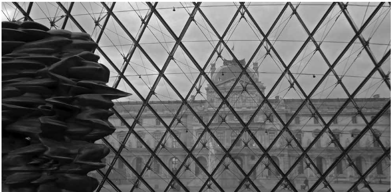
Figura 7: Musée du Louvre Vista del ala Sully desde el interior de la Pirámide

El imperativo industrial permanece más que nunca a la orden del día en estos tiempos de competición mundial exacerbada: el imperativo de la conservación se encuentra subordinado a este, y son frecuentemente contradictorios. El eco que este último sus-