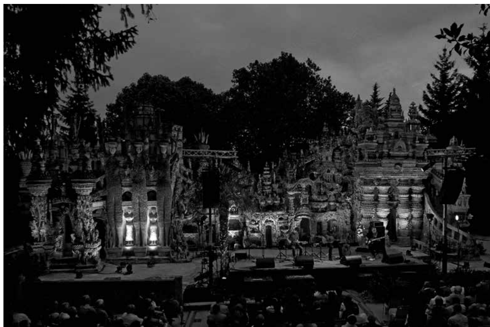
Figura 5: Palais idéal du facteur Cheval Concierto nocturno en frente del Palacio ideal del cartero Cheval