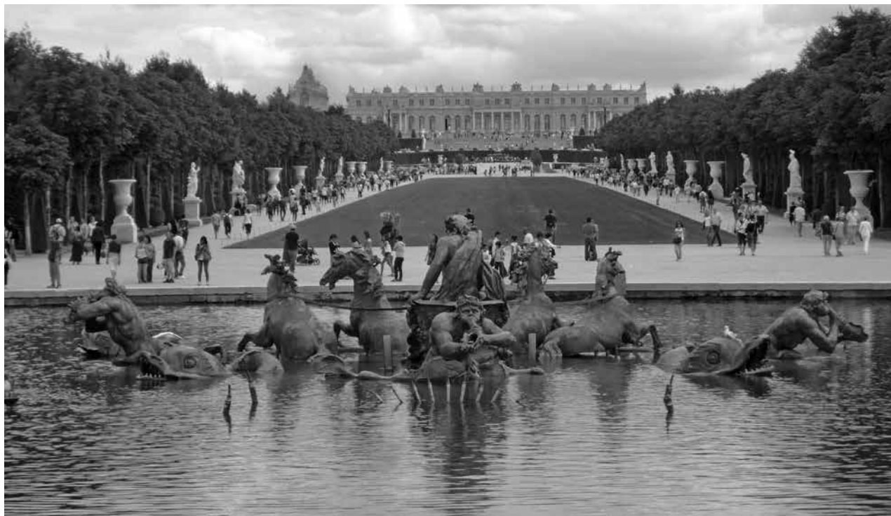
Figura 6: Bassin d'Apollon (Château de Versailles) Perspectiva del Palacio de Versailles desde la fuente de Apolo

(castillos, palacios), u objetos construidos con un propósito práctico pero investidos luego de algún tipo de valor estético o histórico (como por ejemplo: puentes, lavaderos u hornos que hoy en días están “clasificados”). Riegl propuso dividir los monumentos en tres categorías. Los más específicos y considerados como tal desde un principio son los monumentos intencionales , “obras destinadas por la voluntad de sus creadores a conmemorar un momento preciso o un acontecimiento complejo del pasado”. Los monumentos históricos son más difíciles de reconocer por cuanto son susceptibles de ser catalogados como tales posteriormente a su producción material, siendo aquellos que “remiten a un momento específico, pero cuya escogencia es determinada por nuestras preferencias subjetivas”. Finalmente, definidos de manera reciente y aún más extensiva, encontramos los monumentos antiguos , que comprenden “todas las creaciones del hombre, independientemente de su significación o de su destinación original, con tal de que estas testimonien de forma evidente el hecho de haber sufrido el paso del tiempo”.