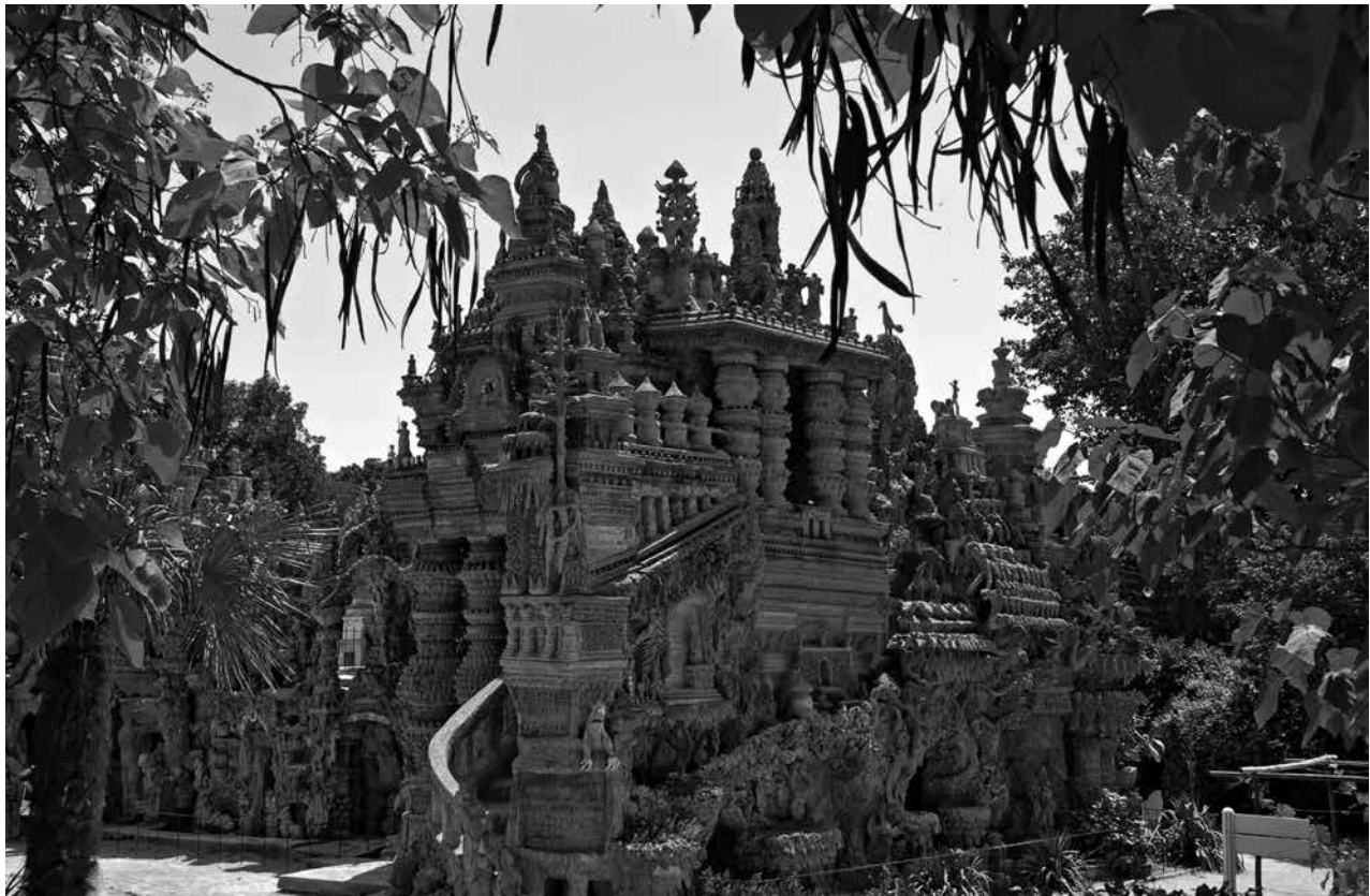
Figura 3: Palais idéal du facteur Cheval Palacio ideal del cartero Cheval, en Hauterives

10. Sobre el paso del folclor a la etnología ver especialmente Jeannot (1988) [N. del A.]