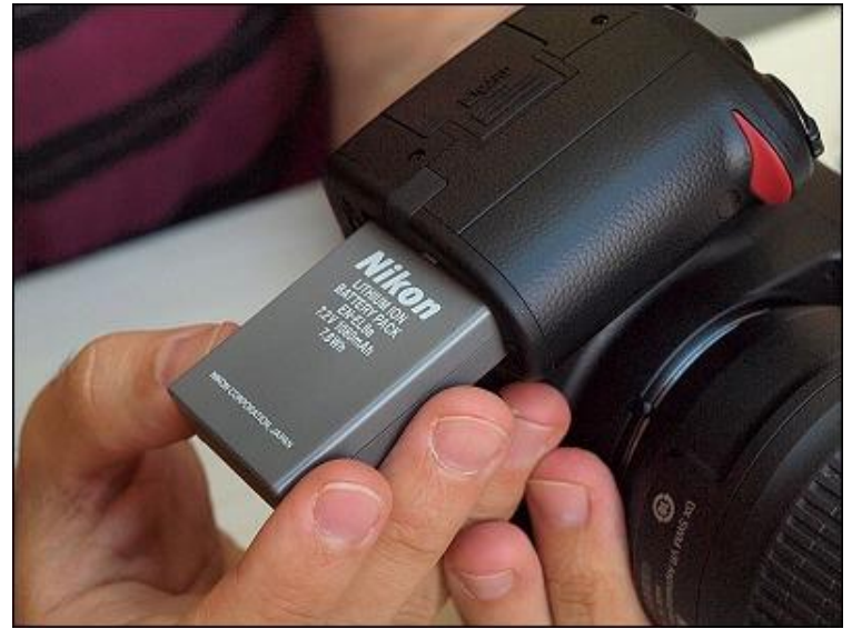
Compartimento para Batería