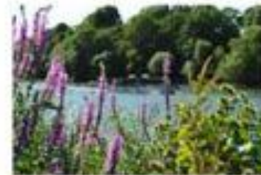
1/250 sec f/8 | 82mm | ISO 100