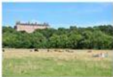
1/250 sec f/8 | 82mm | ISO 100