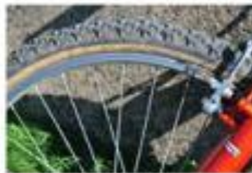
1/200 sec f/7.1 | 82mm | ISO 100