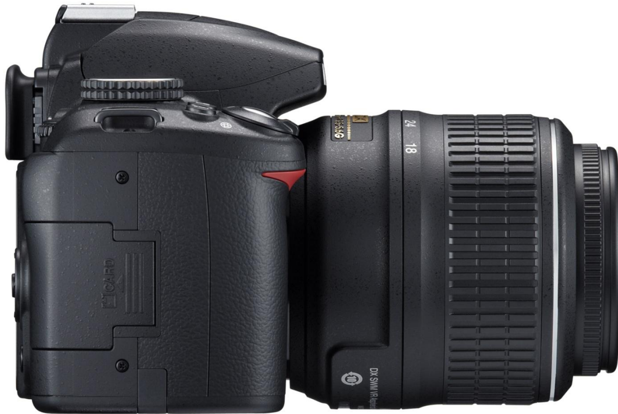
Cuerpo de la Cámara