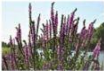
1/320 sec f/9 | 82mm | ISO 100