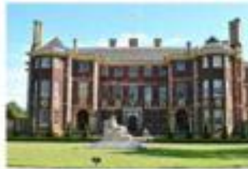
1/160 sec f/8.3 | 48mm | ISO 100