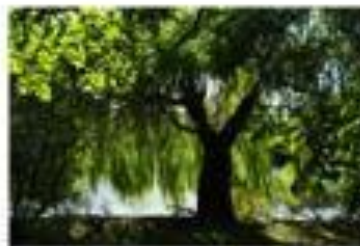
1/125 sec f/5.6 | 38mm | ISO 100