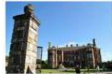
1/250 sec f/8 | 27mm | ISO 100