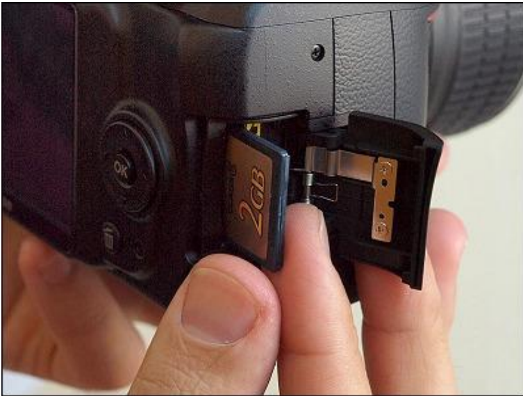
Compartimento para tarjeta SD